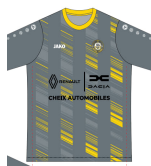
Jeu de maillots + shorts A partir de 1000€