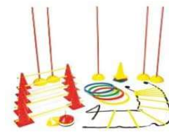
Matériel entraînement A partir de 150€