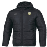
Parka officielle A partir de 90€