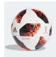
Ballon de match A partir de 45€