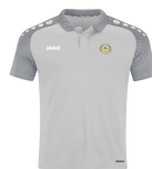
Polo officiel A partir de 30€