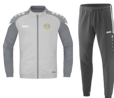
Survêtement officiel A partir de 55€